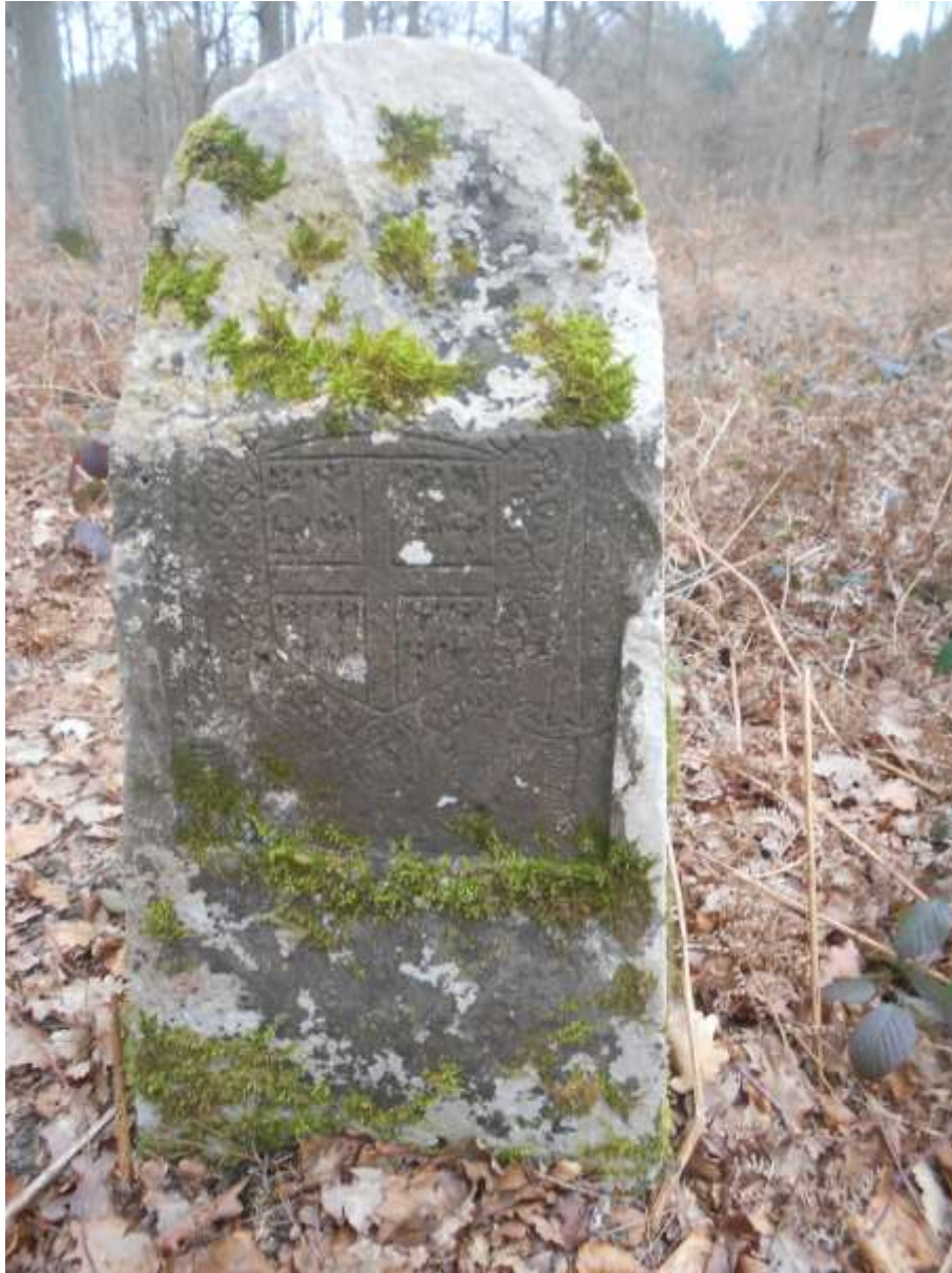
16 aiglons entourés du collier de l'ordre de St Michel, flanqué de deux épées levées et surmonté d'une couronne