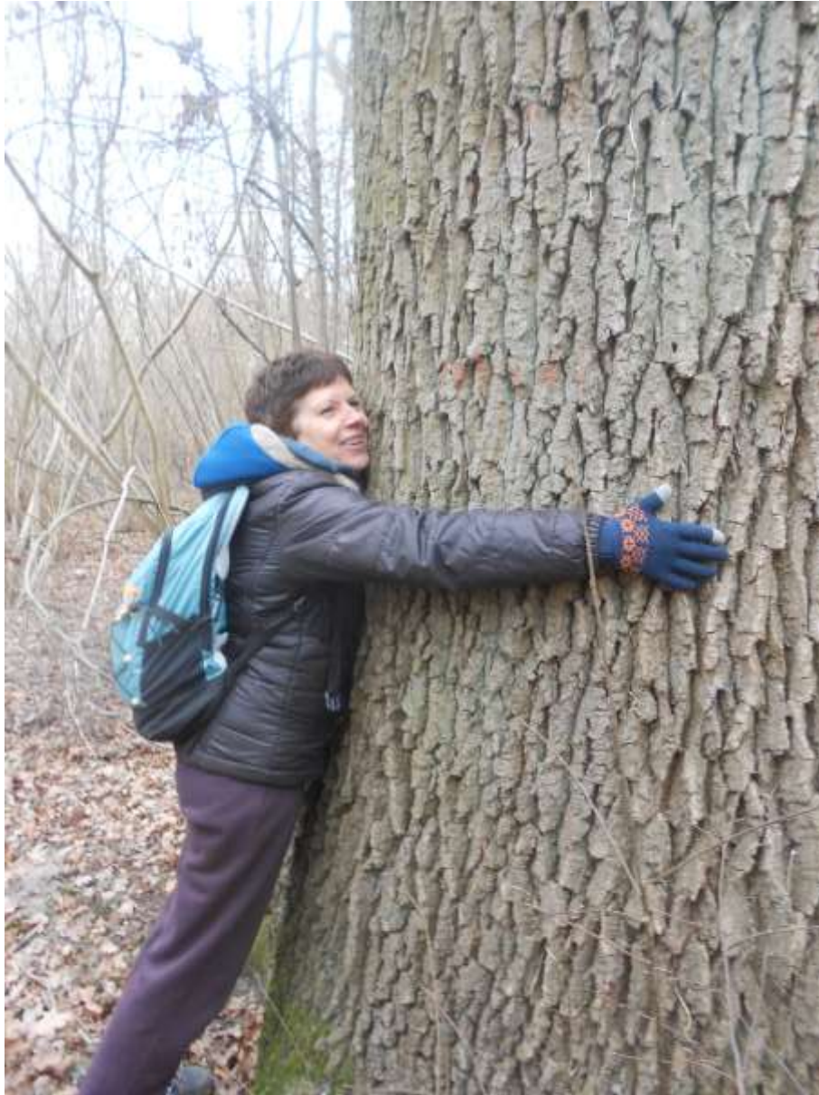
Christiane n'a pas pu résister à l'amour du chêne