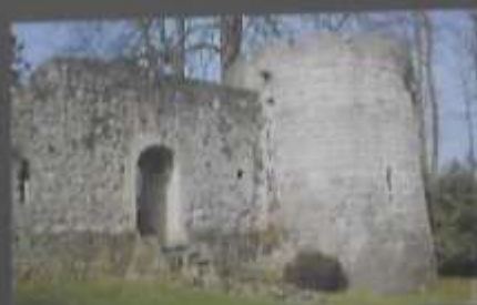
Vue actuelle d'une des tours