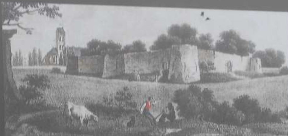
Le château vers 1940, par Cernan

A quelques distances du centre urbain originel, un second noyau de peuplement se développe, à partir du Moyen-Âge. Il est progressivement protégé par d'importantes défenses, représentatives des évolutions de l'art militaire médiéval.