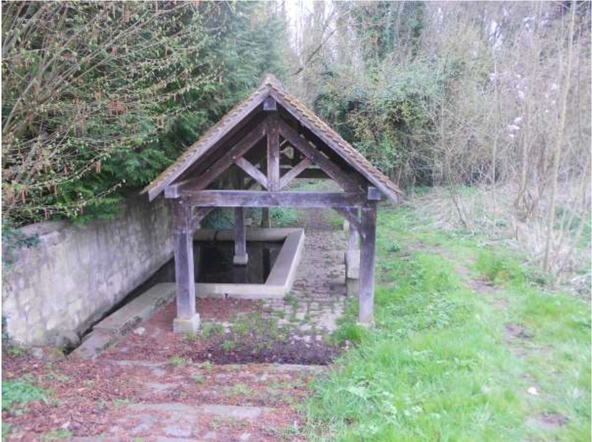
Le lavoir de Gascourt, établi sur un ruisseau qui alimente le ru Popelin. Ce lavoir est une reconstitution du lavoir d'origine, dont seulement le pavage et les pierres ont pu être récupérés.