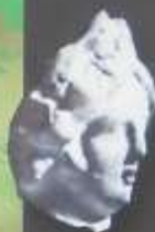
Tête de Venus. 2 e siècle ap. J.-C. M. Goussier

Durant le I er millénaire avant J.C., les Celtes (Gaulois) s'installent ici, sur ces franges du nord de la plaine de France. Entouré de défenses naturelles, un oppidum (camp-village) domine le carrefour commercial. Puis les Romains développent les villae , grandes exploitations agricoles.