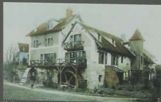
Un des nombreux moulins de l'Ysieux