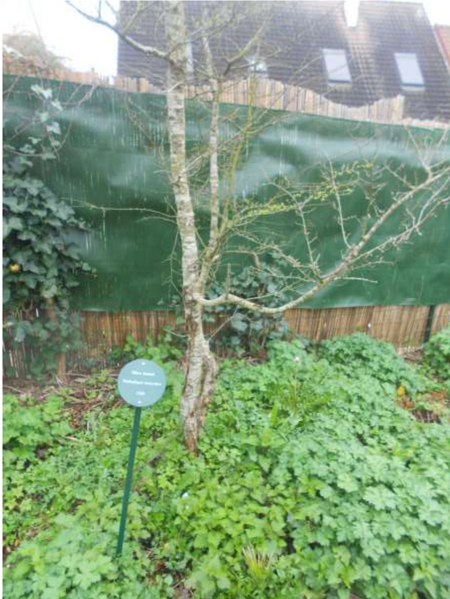
Le hêtre avant l'avoir été