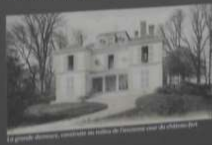
La grande demeure, construite au début de l'histoire sur le château-fort

Les ruines ont fait l'histoire de Luzarches.