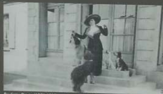
Paulette Darty (1871-1939), sur le seuil du château de Thimécourt

Enfin, ici, la géographie a entraîné un paysage varié, abritant notamment des milieux naturels rares et fragiles :