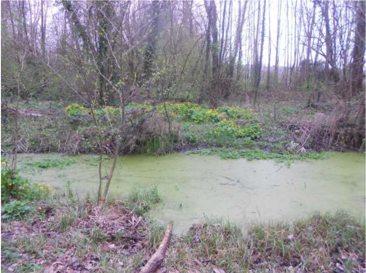
Soupe géante de cresson