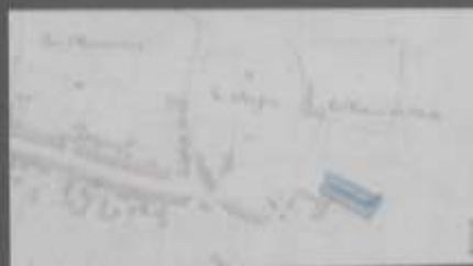
Cadastre napoléonien, début 19 e s.

Observez : la motte est visible, à travers les feuillages, face à vous, ainsi que 30 m plus loin sur le circuit, à travers les grilles du parc.