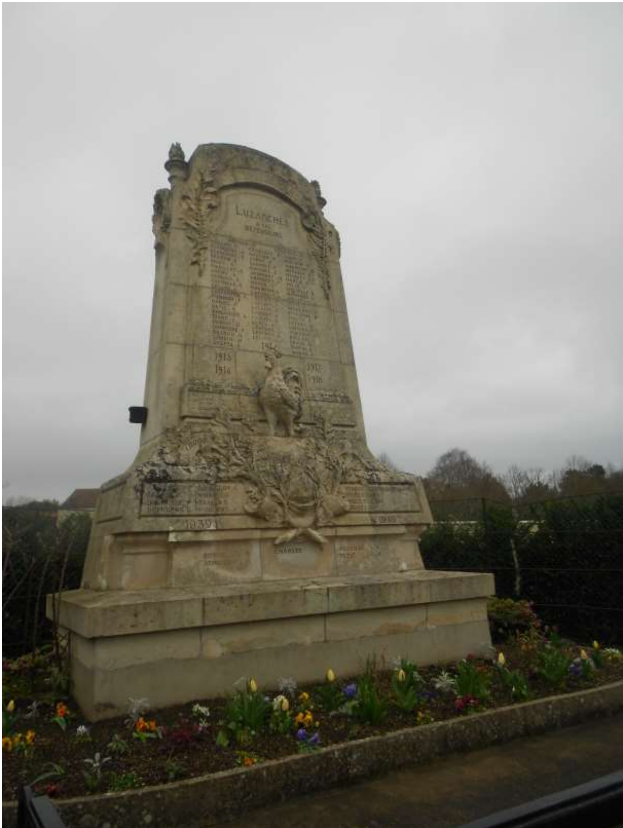
Monument aux morts de Luzarches, en commémoration de la Première Guerre mondiale, dessiné par l'architecte Naudin