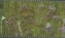
Papillons Belladonna et Demi-dieu