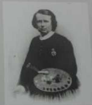
L'artiste porte la Légion d'honneur que lui a remise l'Impératrice Eugénie.

N ée en 1822 à Bordeaux, Rosa Bonheur connaît très jeune la célébrité comme artiste peintre. Ce sont surtout les animaux qui l'inspirent. En 1849, Le labourage nivernais est acclamé par la critique ; en 1853, Le marché aux chevaux lui apporte une gloire internationale. Elle s'installe à By en 1860, dans une demeure qui fut, jusqu'à la Révolution, la résidence occasionnelle des seigneurs de By. Elle y aménage deux ateliers. Dans le parc attenant à la maison, de nombreux animaux, y compris des lions, pourront s'ébattre : autant de modèles pour ses œuvres. À By, les plus célèbres personnalités du siècle finissant sont venues rendre hommage au talent de l'artiste : l'Impératrice Eugénie mais aussi le Président Sadi Carnot, et même l'Américain Buffalo Bill qui lui offrira un costume d'indien. À sa mort en 1899, le château de By revient à sa dernière compagne, Anna Klumpke, qui a dès 1909 l'idée d'ouvrir l'atelier, resté intact, au public.