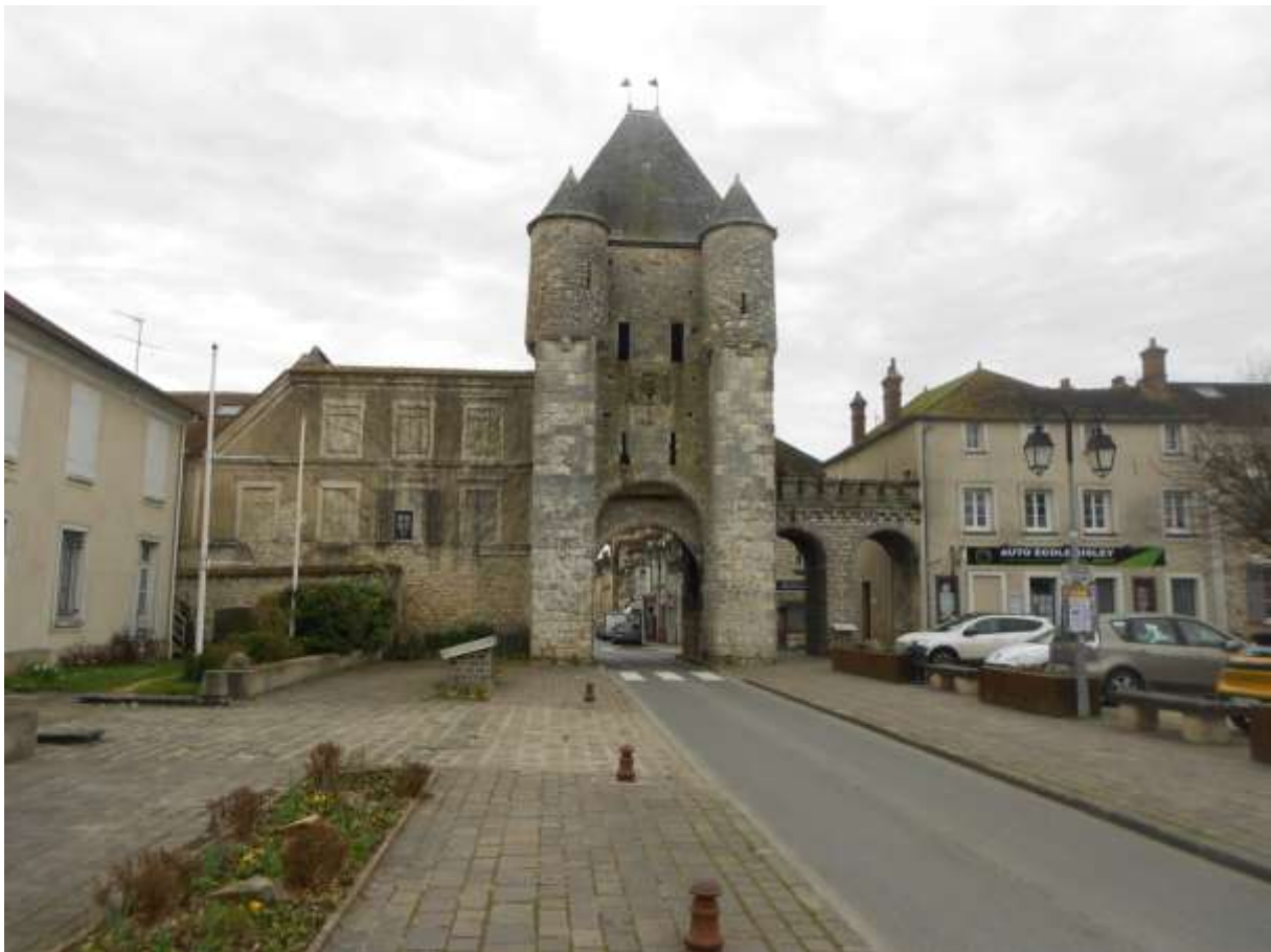
Tour-porte de Moret