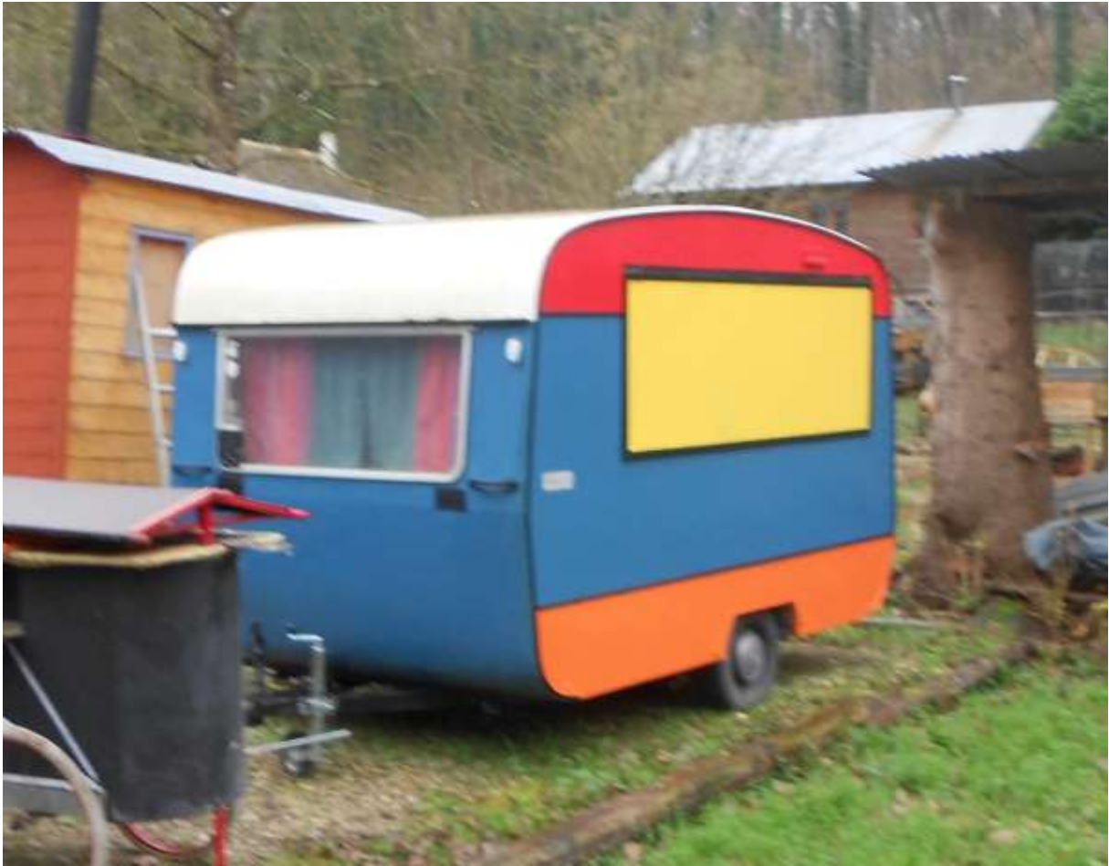
Caravane de Mondrian