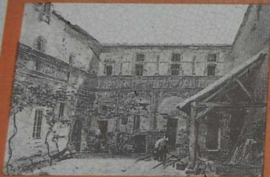
Dessin d'après un tableau de Charles Renoux.