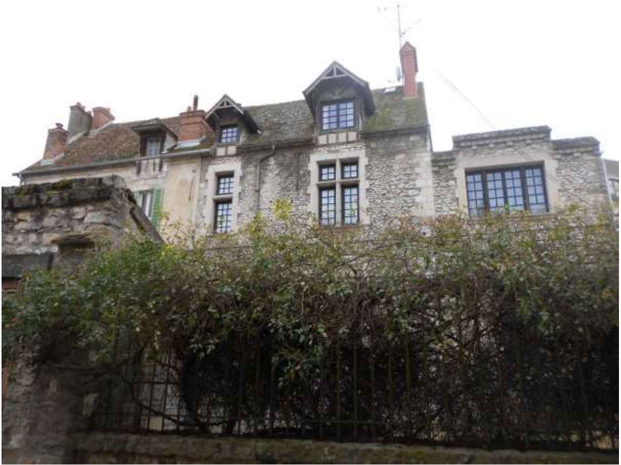
Sisley habita cette maison et y mourut le 29 janvier 1899