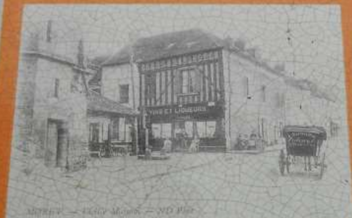
MONTMARTRE — PLACE SAINT-JACQUES — 1870

La maison du Bon-Saint-Jacques avant et après la restauration de sa façade par P. Rizzolet.