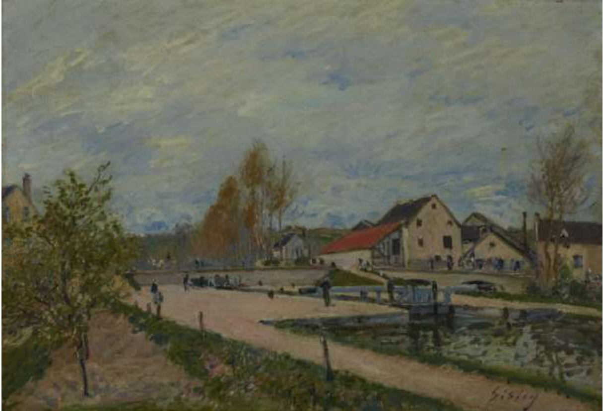
Ecluse de Bourgogne (Sisley)

Peintre des paysages et témoin d'une France plus rurale qu'industrielle, Sisley illustra néanmoins les diverses activités des hommes parmi lesquels il choisissait de travailler (activité des moulins, tannerie, chantiers navals...).