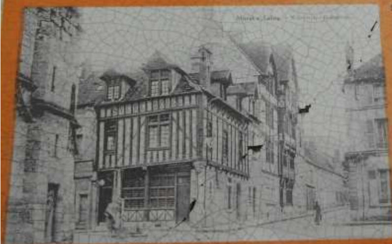
MONTMARTRE — PLACE SAINT-JACQUES — 1870

La maison du Bon-Saint-Jacques avant et après la restauration de sa façade par P. Rizzolet.