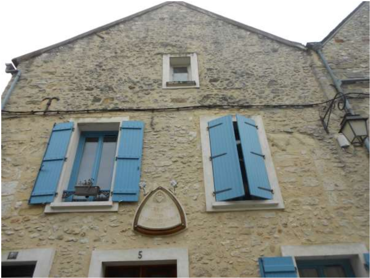
La maison des bonnes sœurs qui font du sucre d'orge