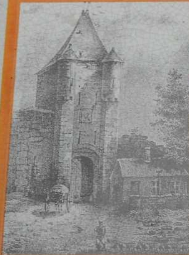
Gravure du XIX e siècle.