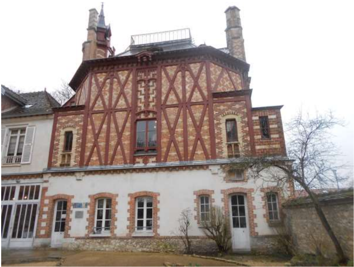
Maison de Rosa Bonheur