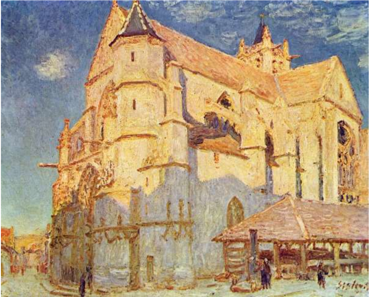
Eglise Notre-Dame de la Nativité par Sisley (1893)

Né à Paris de parents anglais en 1839, Alfred Sisley s'initie à la peinture à Paris aux côtés d'un groupe de jeunes artistes parmi lesquels Frédéric Bazille, Auguste Renoir, Claude Monet... Liés par une volonté commune qui tient tout d'abord au choix de leurs sujets, ils se détachent de la peinture académique et de ses sujets d'histoire pour dépeindre des scènes et paysages de la vie quotidienne ; ils peignent en pleine nature, "sur le motif", et seront à l'origine du mouvement impressionniste à la fin du 19 ème siècle.