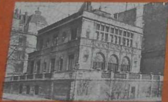
Carte postale début XX e siècle : galerie de la maison Chaboullé remontée à Paris comme façade d'un hôtel particulier.