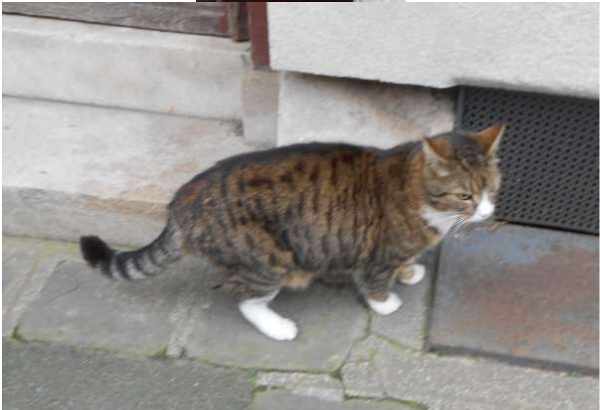
Ce minou nous a suivis un bon quart d'heure