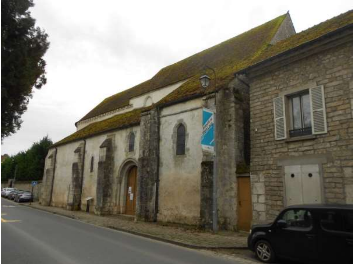
Prieuré du XIIe siècle, dépendance de l'Abbaye de Vézelay, gravement endommagé et en partie détruit au cours des guerres du XIVème siècle.