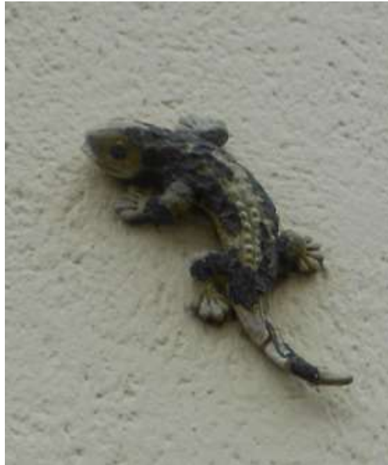
Salamandre, symbole de François Ier

La poétesse Marina Tsvetaeva a passé le mois de juillet 1936 à Moret. Malgré ce court séjour, Tsvetaeva ne resta pas inactive puisqu'elle commença des traductions de poèmes de Pouchkine, préparant ainsi les festivités pour l'anniversaire du 100 ième anniversaire de sa mort qui allait être commémoré en grande pompe par l'émigration russe française en 1937.