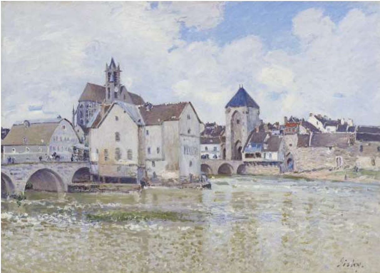
Pont de Moret (1888)

Les premiers propriétaires du tableau ne sont pas connus avec certitude. Le musée d'Orsay indique qu'il fut peut-être la propriété de François Depeaux (1853-1920), industriel français, collectionneur et mécène, qui avait une collection d'environ 600 tableaux, dont de nombreux impressionnistes. La collection Depeaux a été progressivement dispersée au début du 20 e siècle. Le tableau passe alors dans la collection d'Eduardo Mollard jusqu'à 1972. A cette date, il est légué à l'établissement public français Réunion des musées nationaux qui l'attribue au musée du Louvre. En 1986, le tableau est affecté au musée d'Orsay.